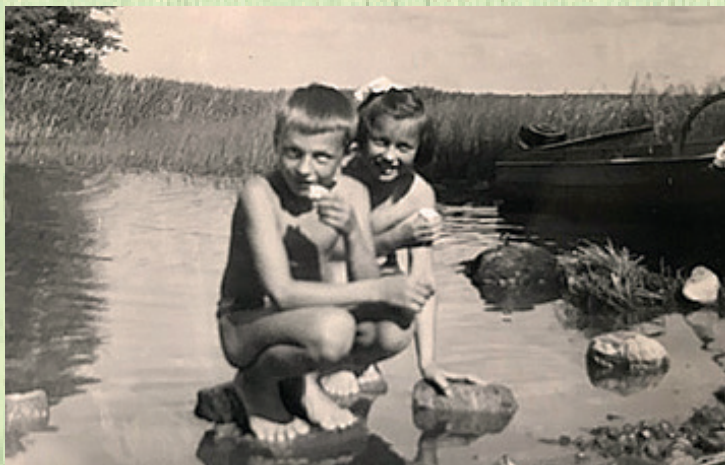
Brorsan och jag badar.