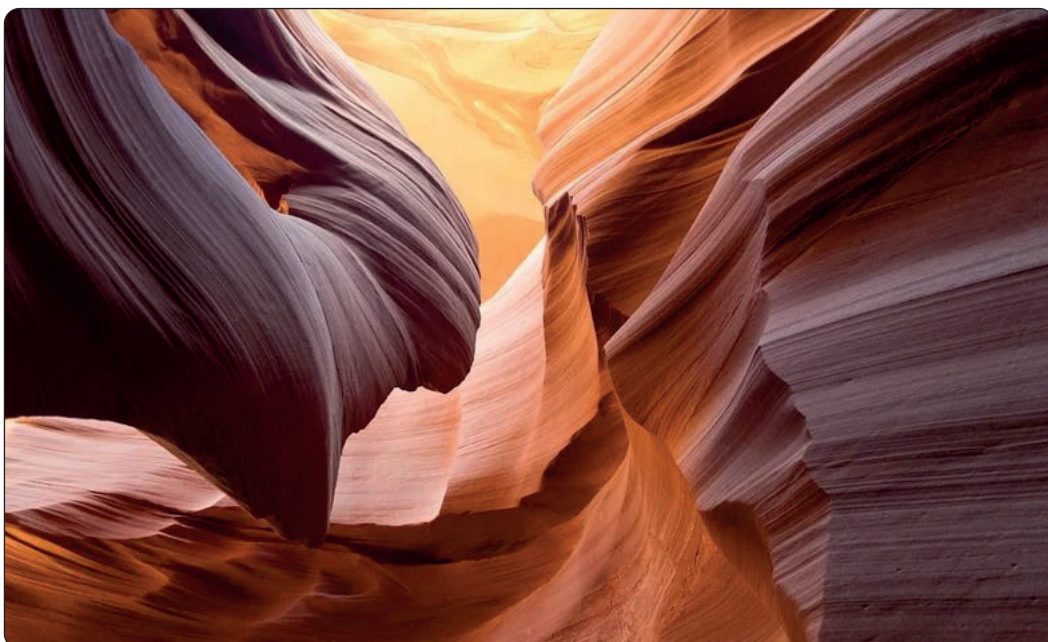
Antelope Canyon i Coconino County i Arizona.